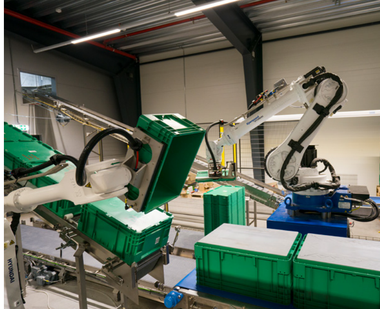
Systemet med plastkasser, som vaskes og genbruges, er udviklet særligt til Region Midtjylland.

For at sikre, at der tages langsigtede, strategiske hensyn, er det nødvendigt at have tilstrækkelig ledelsesfokus på beslutninger i forbindelse med udbud og anskaffelser, og det efterfølgende lager- og logistikflow. Det skal samtidig sikre den sammenhæng på forsyningsområdet, som er nødvendig for, at regionen samlet set kan balancere de forskellige ambitioner og mål. ■